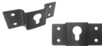
SUPPORTO PER IL FISSAGGIO A PARETE IN DOTAZIONE